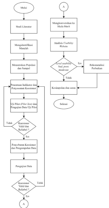
Gambar 2. Diagram Alir Penelitian

dan reliabilitas, webuse dan penelitian terdahulu terkait.