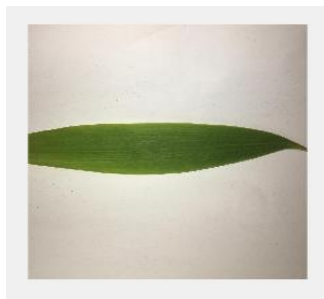
Gambar 1. Cintra Daun Kayu Putih