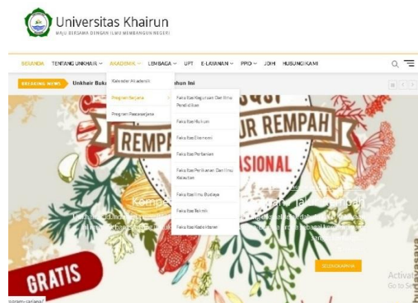
Gambar 4 menu pilihan fakultas

Gambar 4 merupakan menu akademik dimana didalamnya terdapat pilihan seluruh Fakultas Keguruan dan Ilmu Pendidikan, Ekonomi dan Bisnis, Hukum, Teknik, Pertanian, Perikanan dan Ilmu Kelautan, Ilmu Budaya dan Kedokteran yang berada dibawah Universitas Khairun. Bagi calon mahasiswa yang akan memilih bisa melihat fasilitas apa saja yang menjadi atribut dari tiap fakultas ada didalam tiap fakultas baik itu visi misi, jumlah program studi, staf dosen yang mengajar, tenaga kepegawaian, ruang belajar, perpustakaan, laboratorium dan lain-lain.