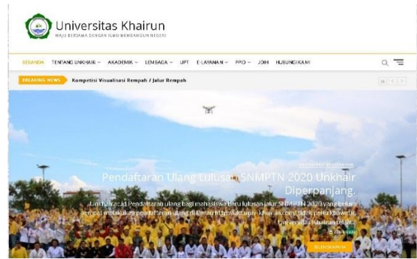
Gambar 2 Tampilan Awal

Karakteristik responden yang digunakan dalam penelitian ini meliputi fakultas, jenis kelamin dan semester. Berdasarkan hasil statistik deskriptif menunjukkan bahwa responden berasal dari seluruh fakultas yang berada dibawah